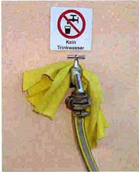
Die Zapfstelle für die Gartenbewässerung ist entsprechend gekennzeichnet.