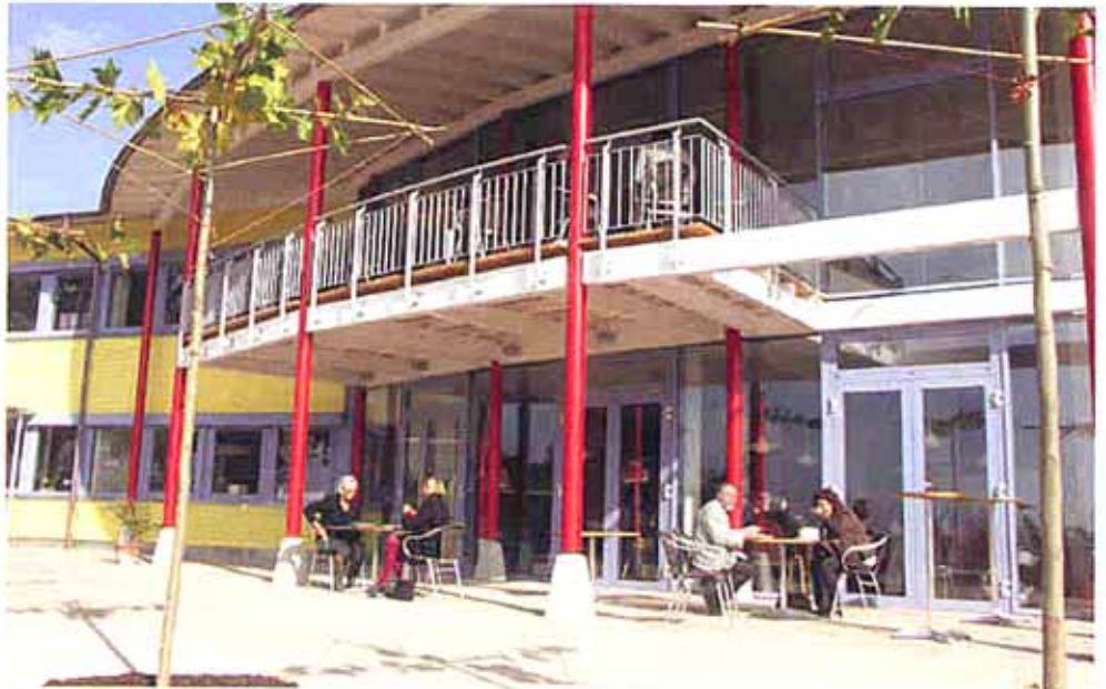
Lichtdurchflutet mit immer neuen Ausblicken: die Südseite des Werkstufengebäudes lädt zum Verweilen ein.