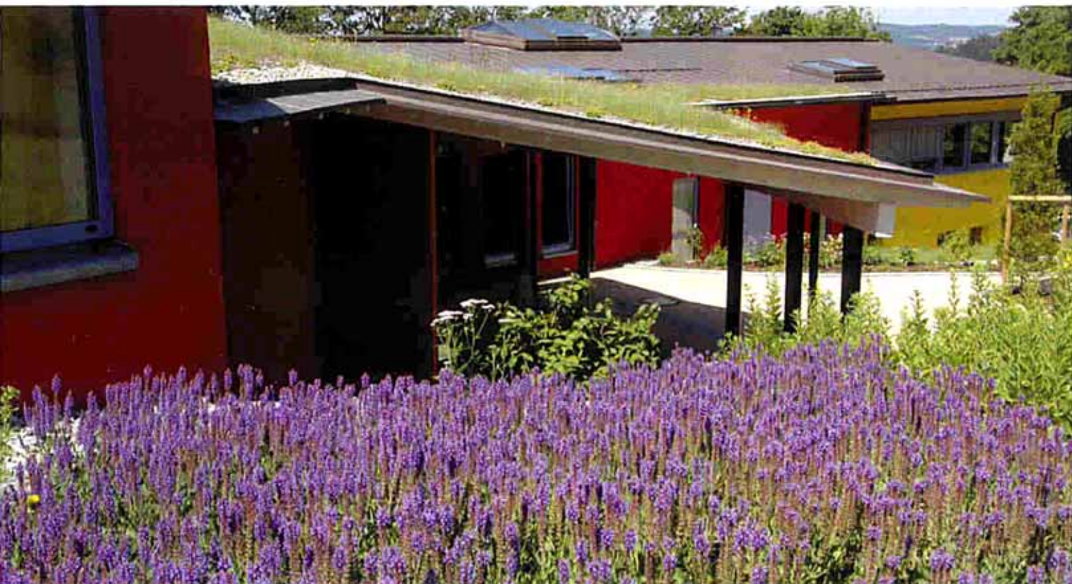
Ein intensiver Lavendelduft weht im Sommer über Föhrenbühl.