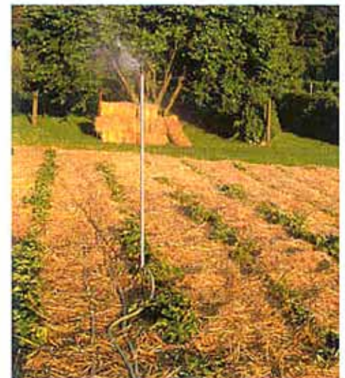
... und das Erdbeerfeld in der angeschlossenen Demeter-Gärtnerei.