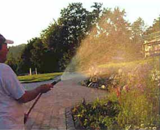
Die gesamten Außenanlagen werden mit Betriebswasser aus der Hangquelle bewässert.