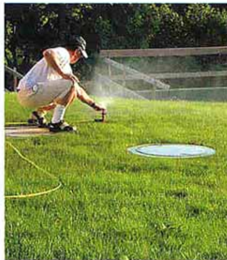
Betriebswasser speist auch sämtliche Regner für die Rasenflächen...