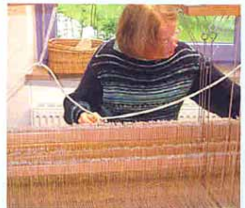
Föhrenbühl ist eine Heimsonderschule für behinderte Kinder und Jugendliche mit angeschlossenen Werkstätten.