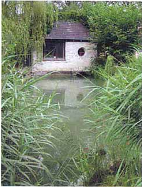
Die Zisterne und der Wiesenbach werden aus dem Teich gespeist.