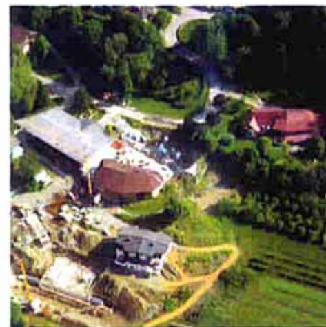
Organisch schmiegen sich die Gebäude der integrativen Wohn- und Schulgemeinschaft an den Hang.

Im Juli 2004 fiel der Startschuss für ein umfangreiches Bauprogramm. Gefördert mit Bundesmitteln aus dem Investitionsprogramm „Zukunft, Bildung und Betreuung“, mit Landesmitteln durch das Oberschulamt sowie Ei-